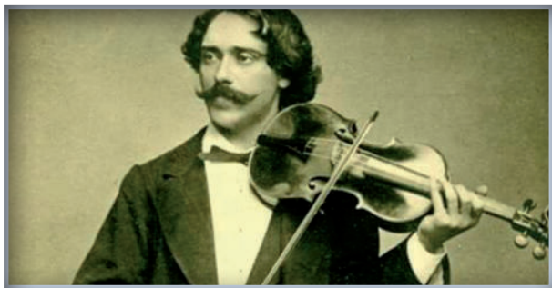
Pablo de Sarasate